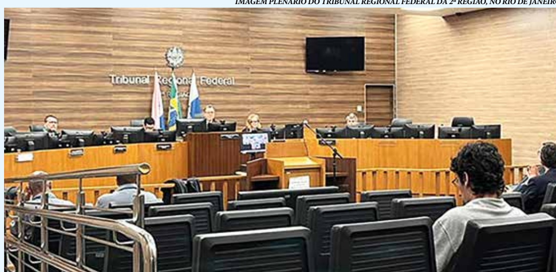
IMAGEM PLENÁRIO DO TRIBUNAL REGIONAL FEDERAL DA 2ª REGIÃO, NO RIO DE JANEIRO

Diante da ausência de medidas estruturais por parte do governo federal, o MPF ajuizou, em setembro de 2021, uma ação civil pública contra a União, com pedido de tutela de urgência. A ação buscava a revisão das políticas públicas, a flexibilização dos termos de consentimento e a implementação de pro-